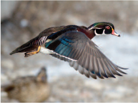
Canard branchu Aix sponsa . Wood Duck.

gestion de l'activité cynégétique à laquelle l'ensemble des parties prenantes adhère. Le défaut de connaissances conduisait à l'impossibilité d'agir efficacement alors même que des conditions environnementales défavorables (sécheresse) provoquaient un déclin de certaines populations (WILLIAMS et al. , 2002).