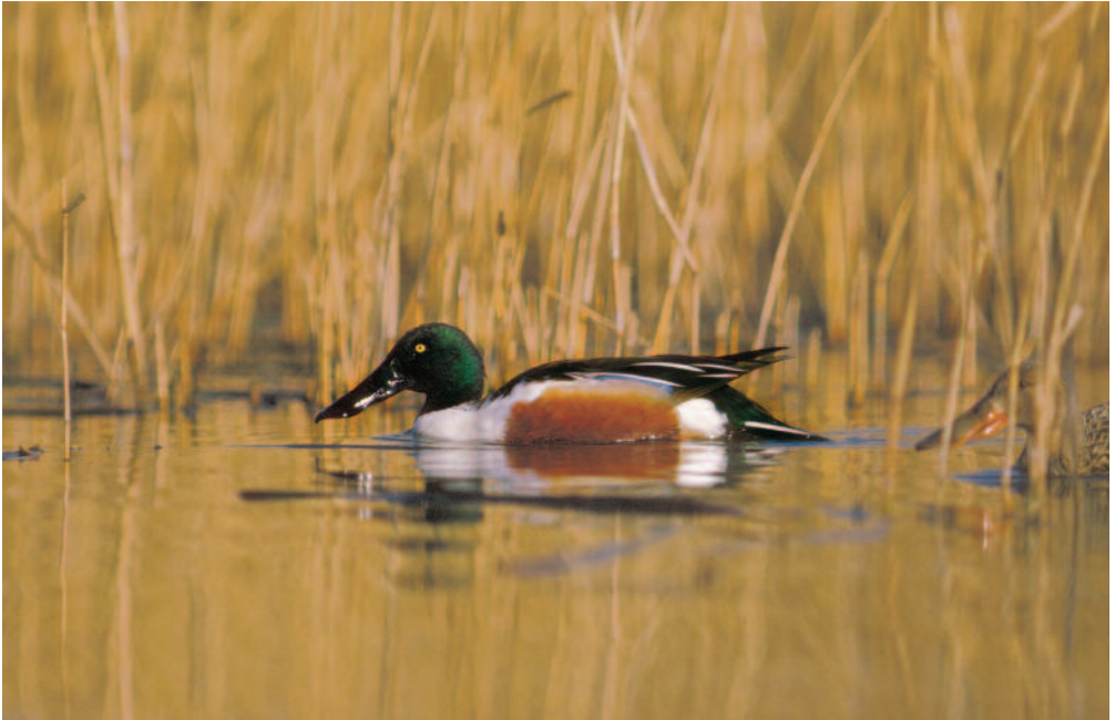
Canard souchet Spatula clypeata . Northern Shoveler.

s'agit de mettre en place une gestion des populations mais qu'un certain nombre d'incertitudes demeurent. Étendre la gestion adaptative à une plus large gamme d'oiseaux migrateurs en Europe semble donc un bon moyen de fédérer les efforts pour la conservation et une exploitation raisonnée de ces populations. Le Plan Biodiversité présenté par le Ministre de la Transition Écologique et Solidaire au début de l'été 2018 prévoit ainsi de mettre en place rapidement une gestion adaptative des espèces chassables en France. ●