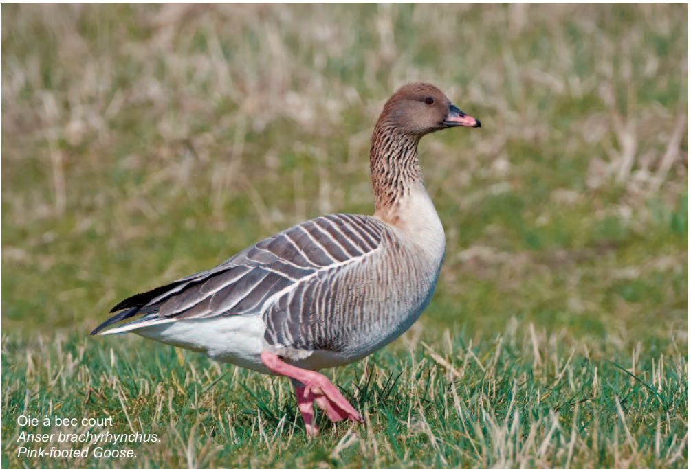
Oie à bec court Anser brachyrhynchus . Pink-footed Goose.

Des tentatives pour gérer de manière concertée les prélèvements d'anatidés en Europe ont été commencées dès les années soixante (e.g. NICHOLSON, 1964; LAMPIO, 1972), mais ce n'est qu'avec la Directive Oiseaux en 1979 (Directive 79/409/CEE, reprise en Directive 2009/147/CE) et la mise en place de l'Accord sur la conservation des oiseaux d'eau migrateurs d'Afrique-Eurasie (AEWA) au milieu des années quatre-vingt-dix qu'une réelle gestion opérationnelle de ces espèces à l'échelle de leurs voies de migration a vu le jour en Europe (voir BOERE, 2010). L'AEWA promeut en particulier une exploitation durable des populations d'oiseaux d'eau migrateurs via une gestion adaptative de leurs prélèvements (MADSEN et al. , 2015), devenue obligatoire pour la chasse de certaines espèces au statut de conservation défavorable dans les états signataires de l'Accord. Le plan d'action pour le Courlis cendré Numenius arquata contient par exemple une telle recommandation (BROWN, 2015), et le changement de statut IUCN de certaines autres espèces pourrait conduire à la même situation.