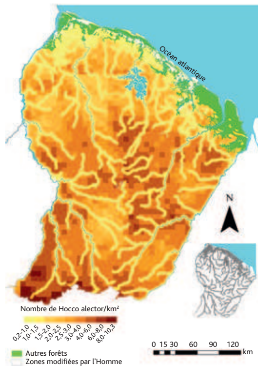
Figure 1 Carte prédictive de la distribution du hocco alector (individus/km 2 ) en Guyane.

Les prédictions sont réalisées uniquement pour les forêts de terre ferme. Les autres forêts (forêts de sable blanc, forêts régulièrement inondées comme les mangroves ou forêts marécageuses) sont représentées en vert. Les zones modifiées par l'homme (savanes, zones artificielles, agricoles ou encore perturbées) sont représentées en blanc. Les zones d'eau comme les rivières principales, le lac de Petit Saut et l'Océan atlantique sont représentées en bleu. Les zones en gris sur le plan en bas à droite (zone tampon de 2,5 km long des routes, fleuves ou autour des habitations) sont considérées comme chassées.