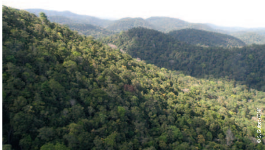
▲ Paysage forestier des montagnes de moyenne altitude (100-500 m), où les modelés géomorphologiques présentent de forts dénivelés (> 90 m).

Dans le bassin amazonien, les forêts de terre ferme se distinguent des forêts saisonnièrement inondées (appelées Varzea ) par la composition de leurs peuplements faunistiques, en particulier les abondances de singes et de grands oiseaux (Haugaasen et al. , 2009). Excepté sur une petite marge de la bande côtière, la grande majorité des forêts de Guyane est de type terre ferme. L'hétérogénéité botanique et structurale des peuplements d'arbres de Guyane, bien décrite localement, a été récemment étudiée à une échelle plus large, celle des paysages (Guitet et al. , 2015a, b). Concernant le peuplement animal, Richard-Hansen et al. (2015) ont montré que la composition et la diversité des communautés de grande faune forestière variaient entre ces différents paysages forestiers. On peut supposer que ces différentes forêts de terre ferme répondent aux exigences écologiques d'une partie de ces espèces, et donc que le patron de distribution d'une espèce donnée est lié en partie aux caractéristiques de son habitat.