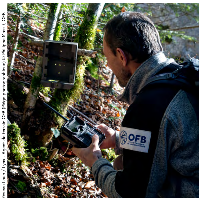
Réseau Loup / Lynx - Agent de terrain OFB (Piège photographique)