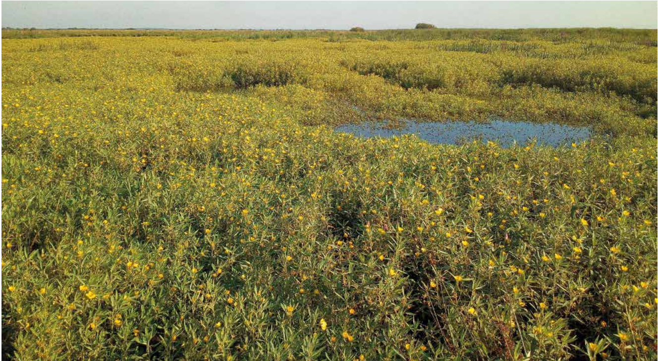
→ Prolifération de jussie dans le marais de Brière (Loire-Atlantique, France), en juillet 2021.